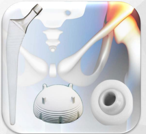
Prótesis de Cadera Doble Movilidad