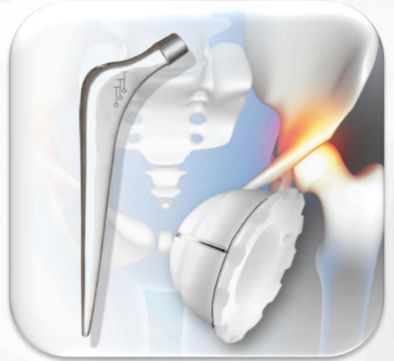
Prótesis de Cadera Cementada