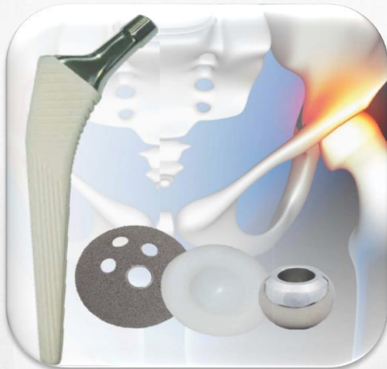
Prótesis de Cadera No Cementada